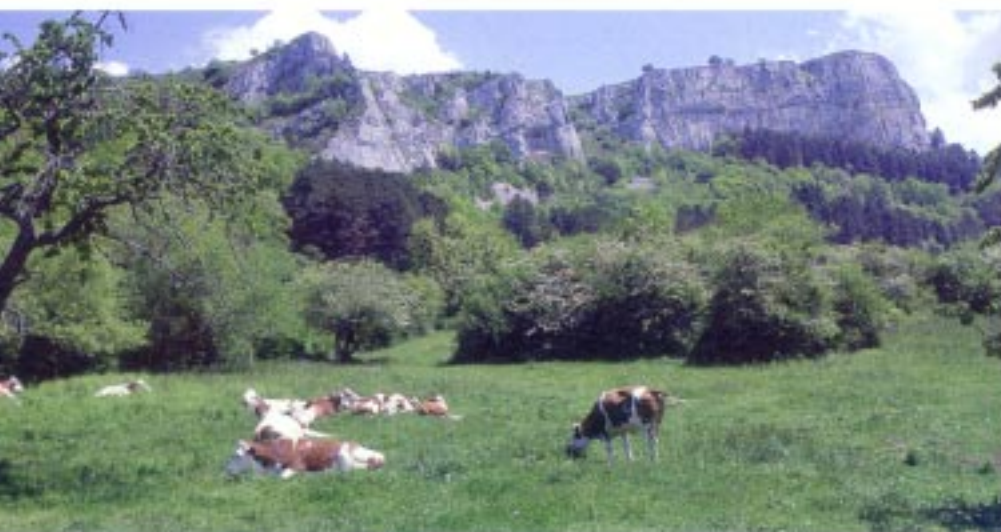
Ursprüngliche Landschaft | In der Franche-Comté gibt es üppige Talweiden und artenreiche Bergwiesen. Hier finden die Montbéliard-Kühe gesundes Futter.

Comté darf bis zu 30 Monate auf Fichtenholz reifen